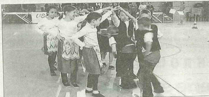
Après les présentations, il y a eu les figures imposées... Ci-dessous les Cerdans d'Ur ont été très applaudis.